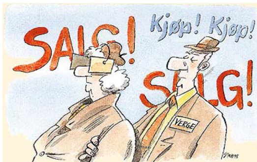
Illustrasjon: Sture Lian Olsen

Hva skjer hvis vi ikke kan ivareta våre egne juridiske og økonomiske forpliktelser og når evnen til å styre vårt eget bo svekkes?