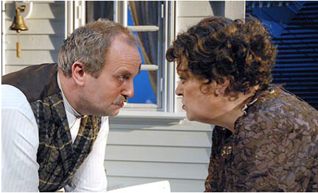
Bilde fra Maktå på straen ved Rogaland teater.

Vi har vært flinke til å oppmuntre og ta med beboerne i peisestuen på fellesarrangementer, det har blant annet vært Stavangervisser, dansetilstelninger og konserter. I tillegg inviterte Rogaland teater beboerne med følge på "makta på straen". Dette var et vellykket arrangement.